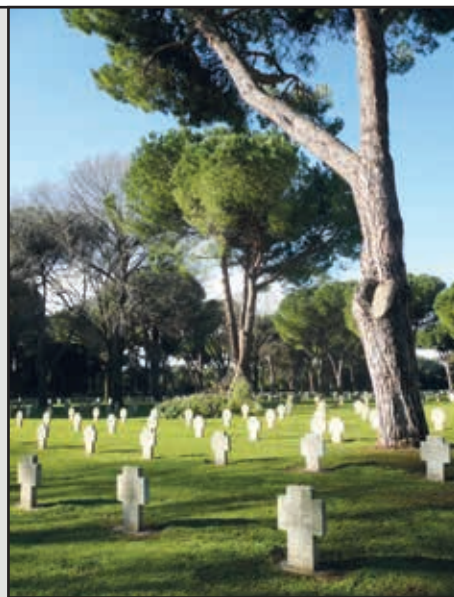
Auf dem Kriegsgräberfriedhof in Pomezia/Italien ruht ein Gefangener aus Herbrechtingen.

EHEMALIGER BUNDESPRÄSIDENT JOACHIM GAUCK