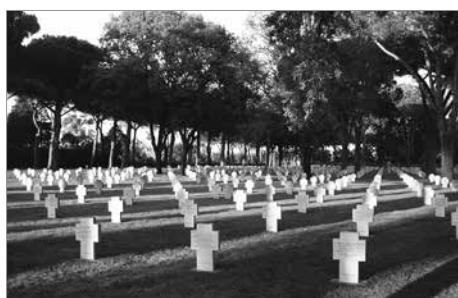
Kriegsgräberstätte Pomezia in Italien, hier ruht ein Gefallener aus Herbrechtingen.