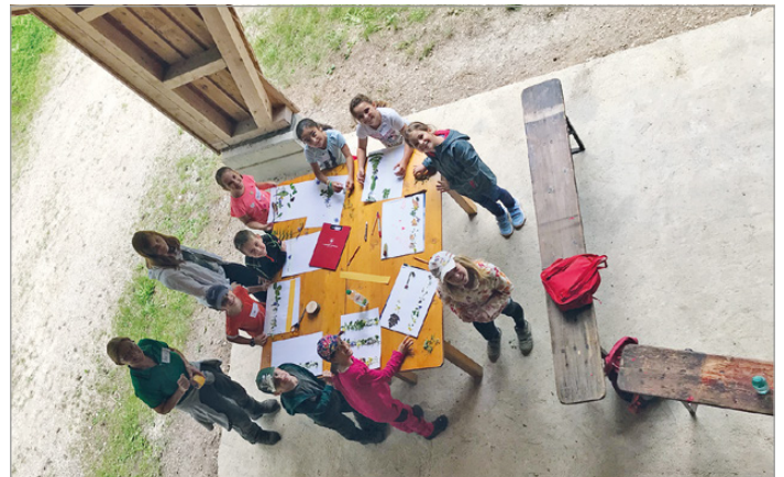
Nach einer kurzen Vesperpause konnten die Kinder an verschiedenen Stationen ihr Geschick beim Sägen von Holzscheiben, beim Nageln an einem Baumstumpf oder beim Erstellen eines Waldbildes unter Beweis stellen.

Hier sieht man die Kinder mit welchem Feuereifer sie bei den Übungen dabei waren. Alle waren begeistert und zum Abschluss gab es noch eine Mütze und eine Vesperbox von unserem Hauptsponsor TWH.