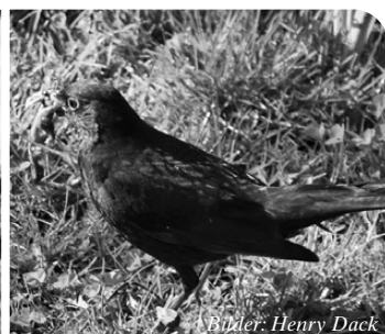
Bilder: Henry Dack