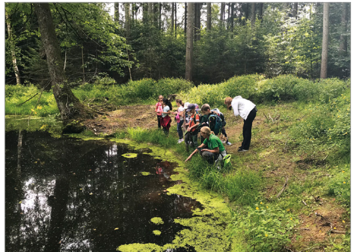
Auf dem Weg zur Hütte konnten die Kinder zahlreiche zuvor versteckte Tiere entdecken und ihre Lebensweise anhand Erzählungen erfahren.