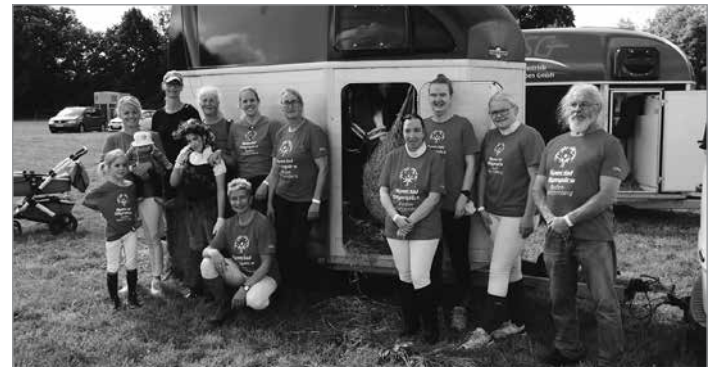
Team vom Sonntag