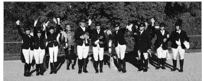
Das Team „Samstag“

Ein ganz besonders dickes Dankeschön aber an alle, die zum Team gehörten und im Vorfeld, wie auch an den Turniertagen selber, zum guten Gelingen des gesamten Vorhabens beigetragen haben!