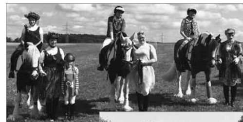
Siegerin und Platzierte vom Sonntag