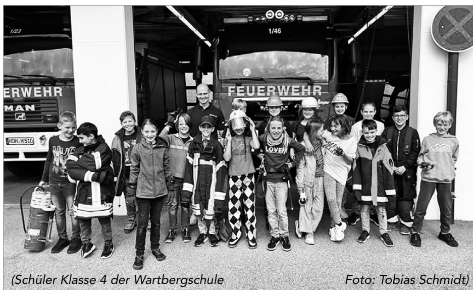
(Schüler Klasse 4 der Wartbergschule

Anschließend folgte eine Führung durch die Feuerwehr und die Besichtigung der Fahrzeuge. Zum Abschluss durften alle einmal mit dem Strahlrohr spritzen. Verabschiedet wurden die Kinder mit einer Tonfolge Martinshorn.