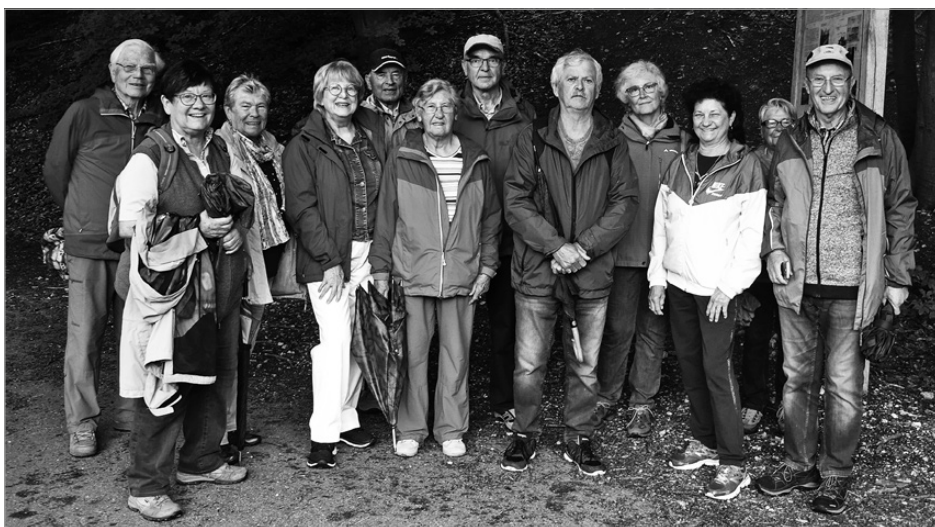
(Die Teilnehmer der Wandergruppe

Über das Viadukt ging der Weg weiter bis zum Tunnel, der mittlerweile verschlossen ist und Fledermäusen als Quartier dient.