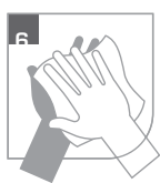
Hände sorgfältig abtrocknen