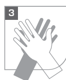
Hände gründlich einseifen