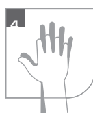
Zwischen den Fingern waschen